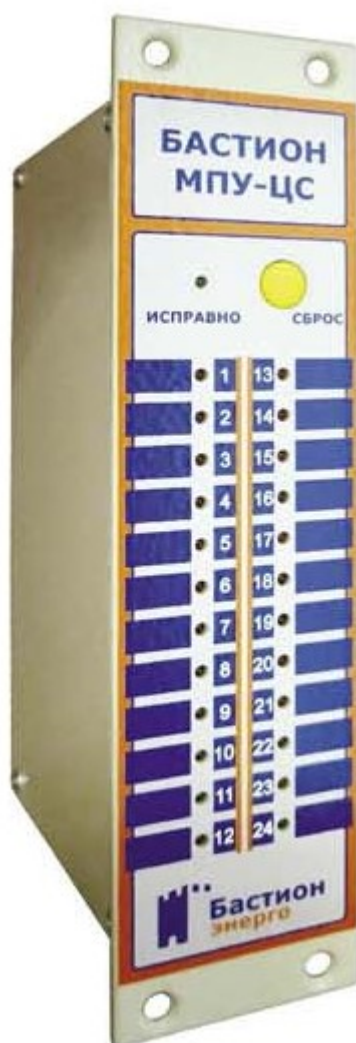
Рис.1. Внешний вид устройства МПУ-ЦС