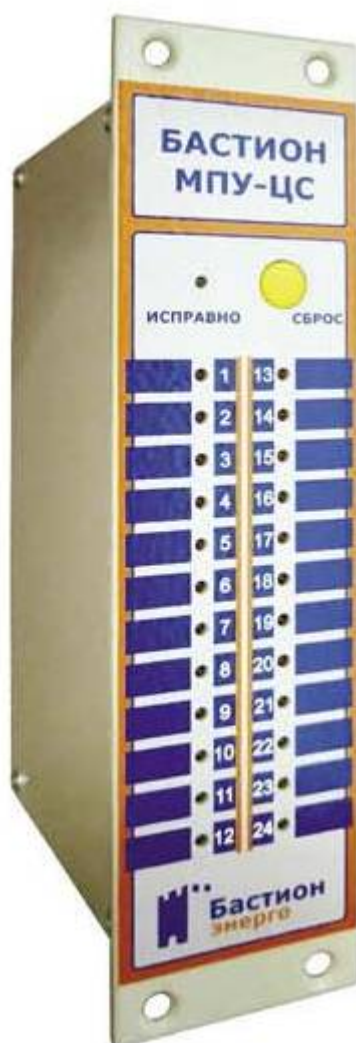
Рис.1. Внешний вид устройства МПУ-ЦС